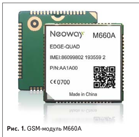
Рис. 1. GSM-модуль M660A

Предусмотренный в модуле M660A режим пониженного потребления (Sleep Mode) позволяет получить среднее потребление модуля меньше 2 мА (в зависимости, в том числе, и от настроек сети). Переход в этот режим осуществляется по-