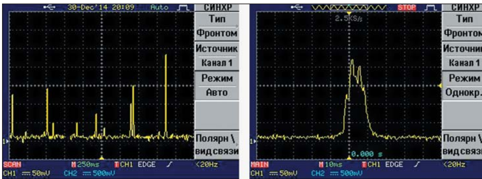
Fig. 3. Осциллограммы тока потребления модуля M660A в режиме энергосбережения